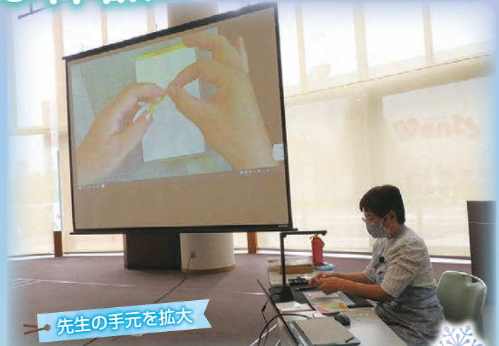
先生の手元を拡大