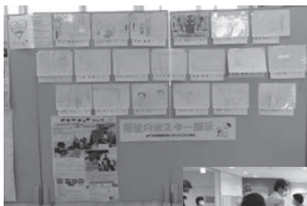
期間中多くの来場者に見ていただきました

さらに、大野西小学校6年生の福祉新聞も掲示。福祉学習の成果の発表の場となりました。