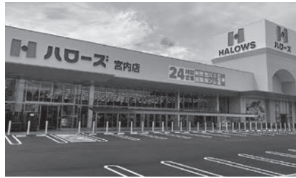
インスタント食品や飲料水等を提供し、地域からも好評のハローズ宮内店

ここ廿日市市でも7月にオープンしたばかりの宮内店が市社協や他の団体を通じて、食糧品などの提供を早々に展開。「ハローズモデル」の仕組みで、定期的に市社協、支援団体などが店舗に食糧品を引取りに行き、子ども食堂や生活困窮者に提供しています。