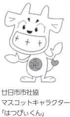
廿日市市協 マスコットキャラクター 「はつぴいくん」

子どもたちの歌や吹奏楽の演奏に癒され、福祉事業所のパフォーマンスと活動紹介に元気をもらいました