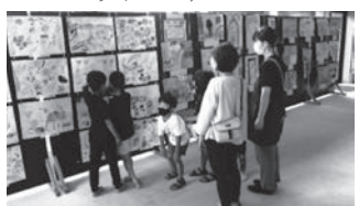
「見てみて、私の作品よ♡」

開催期間中には、宮島福祉センター館内の窓を開放し、来場者には体調確認票に氏名や体温を記入してもらうなど、新型コロナウイルス感染症対策を徹底し延べ177人の来場者がありました。