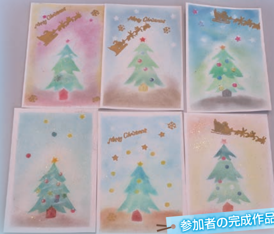
参加者の完成作品