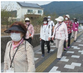
久しぶりのウォーキングで話が弾みます

昨年11月、コロナ禍で密を避けながらも何かできることはないか検討する中、参加者からの「サロンのメニューでウォーキングがあれば参加してみたい！」という声をきっかけに始まりました。緊急事態宣言などの影響でしばらくお休みしていましたが、今回は久しぶりの開催で、積もる話がたくさんです。