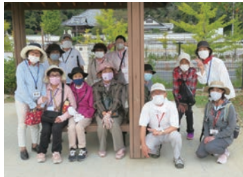
休憩地点の公園で記念撮影

「普段は家に閉じこもりがちなので、皆と一緒に楽しく歩けることが嬉しい」という声も聞かれました。