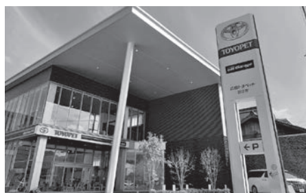
地域の交流の場を提供し、地域から愛される広島トヨペット廿日市店

してスペースを開放していただきました。この絵を見られた「絵画の先生」から問合せがあり、新たなつながりとそこから今後の展開に広がりを見せています。