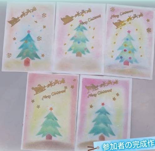
参加者の完成作品