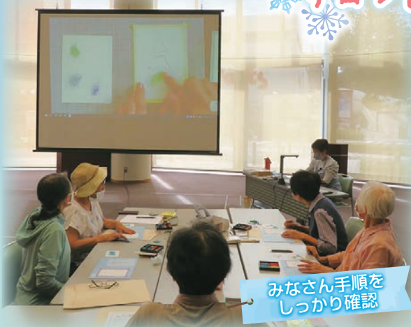
みなさん手順を しっかり確認