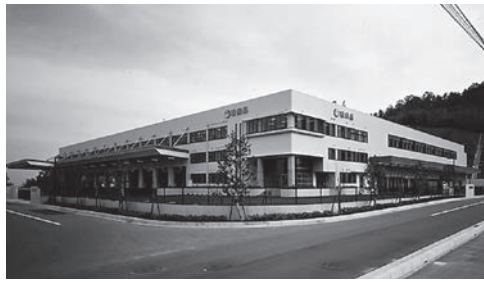
これから市社協と一緒に多様な活動を展開する旭食品広島支店

旭食品広島支店でも食品ロス削減へ積極的に取り組んでおり、市社協を通じて、定期的に食糧品や飲料水を生活困窮者や廿日市市内の団体に提供しています。