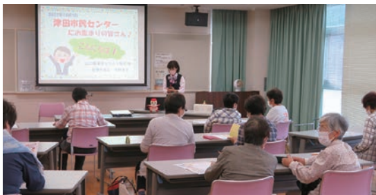
「フレイルを予防して、健康寿命を延ばしましょう！」※フレイルとは、加齢により心身が衰えた状態

最後に「人との繋がり（かわり）は、運動をすることよりも寝たきりのリスクを下げる」というお話があり、地域や人との繋がりの大切さを改めて考えさせられました。