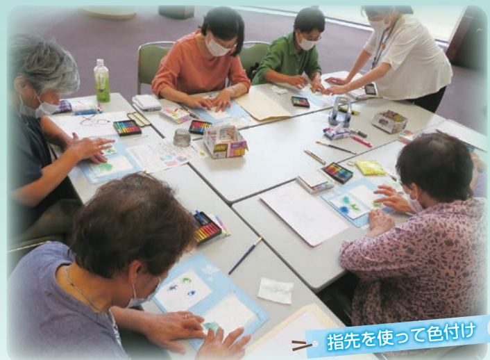
指先を使って色付け