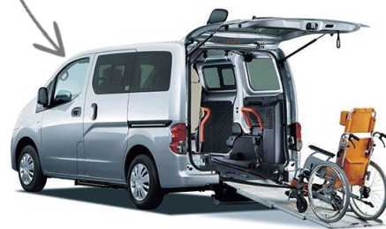
福祉車両の貸出し