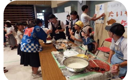
障がい者団体連絡協議会の「小さな夏まつり」で児童・生徒がボランティア活動