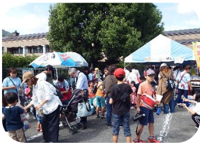
「おおの健康福祉フェスタ」