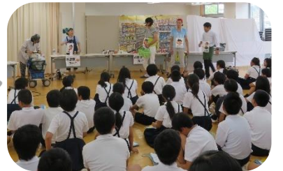
市内小学校で「認知症サポーター養成講座」