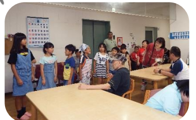
「ボランティア学園」で「アダージョ」を訪問