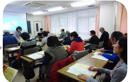
「精神保健福祉ボランティア養成講座」