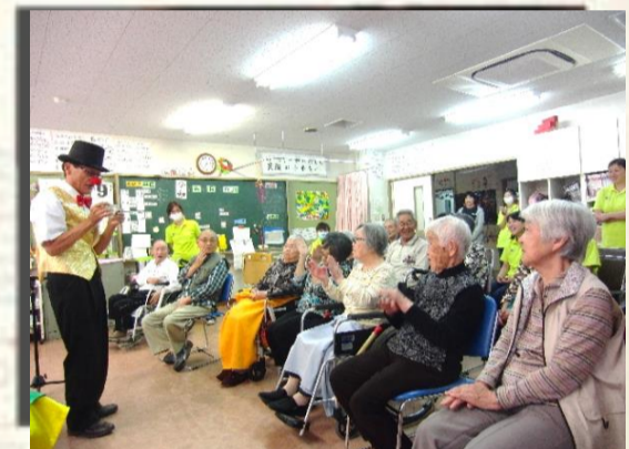
「さあ〜何が出てくるでしょう」 皆さん釘付けです!