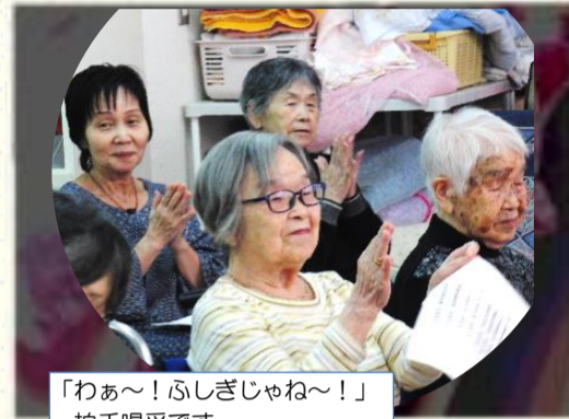
「わあ〜!ふしぎじゃね〜!」 拍手喝采です