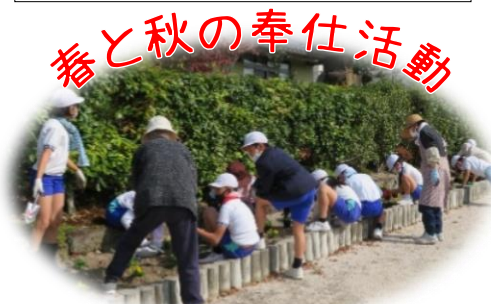
春と秋の奉仕活動