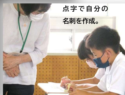
点字で自分の 名刺を作成。