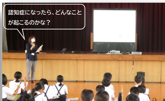
認知症になったら、どんなことが 起こるのかな？