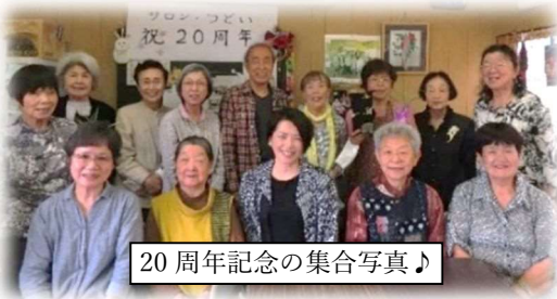
20周年記念の集合写真♪