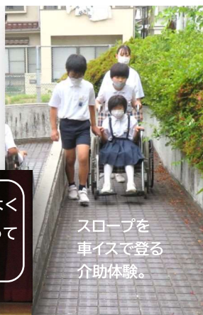
スロープを 車イスで登る 介助体験。

今回の学習は、子どもたちにとって、街中で困っている人を見かけたら、自分だったら何ができるかを考える機会となりました。