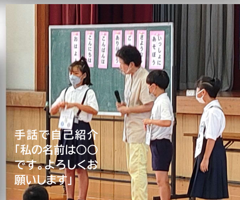
手話で自己紹介 「私の名前は〇〇 です。よろしくお 願いします」