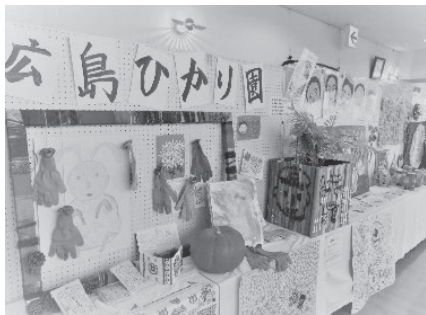
各福祉施設の作品

来年はこれまでのハーモ ニーフェスタが開催される ことを願いながらイベント は終了しました。