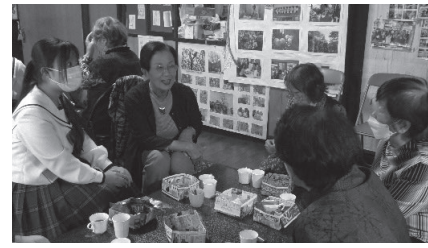
「ここに来るのが楽しみ」と言われる参加者の皆さん

生の先輩の話を聞いて、生徒も貴重な体験ができたと思います」と引率の先生。佐方地区でまた一つ新しいつながりが生まれま