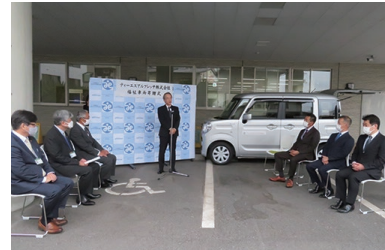
今回の寄贈車両はハイブリット仕様です

「地域貢献することを経営の中心に置いていきます。また、その活動を見て、社員が、会社への誇り、やりがいを感じてもらえたら」とおっしゃったその熱い眼差しからは、地域貢献への真摯な思いが伝わってきました。