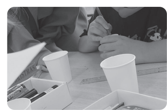
9月はボランティアとみんなと一緒に紙コップを使った万華鏡づくり!こんなに上手にキレイに出来たよ!!