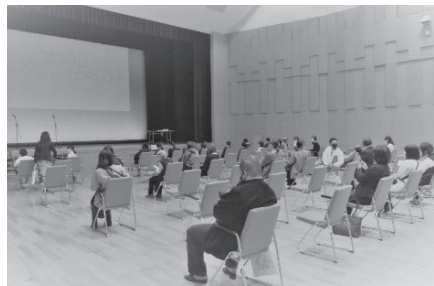
たくさんの皆さんに 集まっていただきました