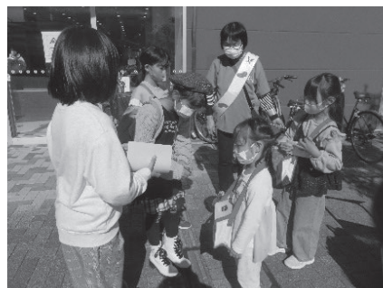
たくさんの募金が集まりました