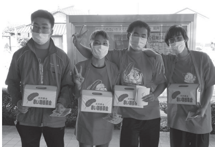
学生ボランティアに共同募金の お手伝いをいただきました