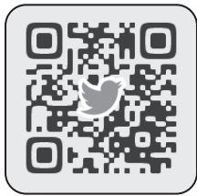
一カメラをかざしてみてねー