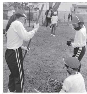
協力して落ち葉清掃!