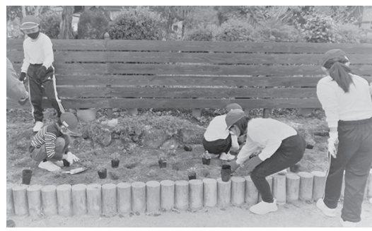
春まで可愛い花が楽しめます

らい、「お手伝いをする人」「救助する人」など、児童からみたボランティア像がたくさんあがりました。児童の皆さんはボランティアから植え方の説明を真剣な様子で聴き、笑顔で会話をしながら植えていました。みんな気持ちよく奉仕活動ができました。ご協力いただいた皆さん、ありがとうございました。