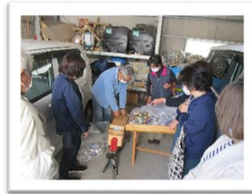
総会終了後アルミ缶つぶし作業の様子 (ボランティア吉和)