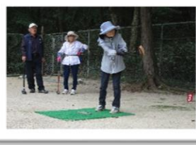
グラウンド・ゴルフの様子 (福寿会)