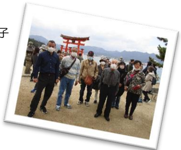
日帰りバスハイクで宮島へ (障がい者福祉協会)