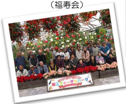
美化研修旅行で松江へ (福寿会)