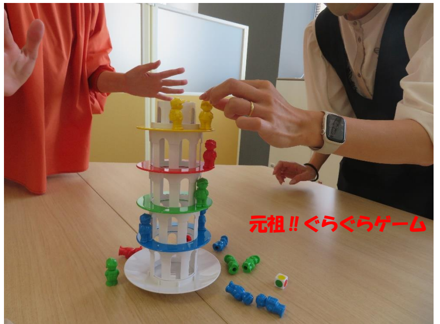
元祖!!ぐらぐらゲーム