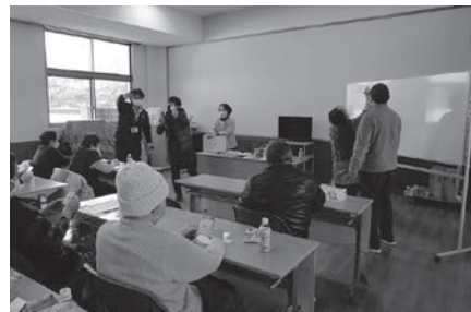
あつまろう家ビンゴゲーム：心ばかりのプレゼントがありました