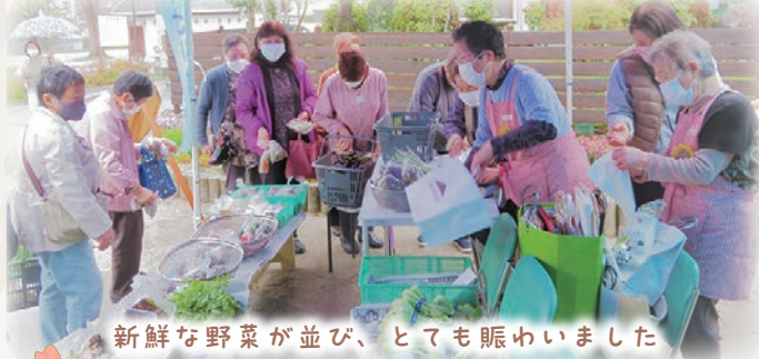
新鮮な野菜が並び、とても賑わいました

発行/社会福祉法人 廿日市市社会福祉協議会 TEL(0829)20-0294 FAX(0829)20-1616 https://hatsupy.jp/