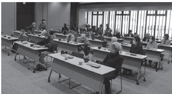
みんなの笑顔が集いました！

原則70才以上の高齢者を対象に、孤立感解消と地域の見守り活動に反映させることを目的に、会食式で行われる高齢者給食サービス。今回は3月28日に開催され、22人が参加しました。この事業は、宮島地区民生委員児童委員協議会から対象者の皆さんに案内を配り、宮島町食生活改善推進協議会に料理を作っていただいています。季節に合わせて彩り豊かなお弁当で、参加者の皆さんにたい