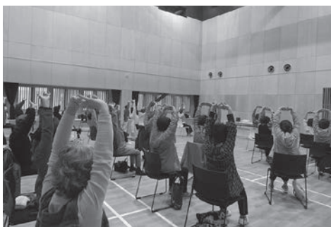
百歳体操の前の準備体操

大野地域では、各区で百歳体操が盛んに開催されています。ご存じの方も多いと思いますが「百歳体操」とは、自分の体力に合った重りを手や足に装着し椅子に座ってゆっくりと手足を動かす体操です。この体操を継続的に行うことで、筋力が付き転倒しにくい体を手に入れることができます。このため、転倒による骨折などが減り、寝たきり予防にもつながります。実際に杖で歩行していた人が、百歳体操を継続的に行った結果、杖なしで歩行することができるなどの報告があります。