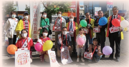
あいプラザまつりでボランティアの皆さんとイベント募金を行いたくさんの方からお気持ちを預かりました