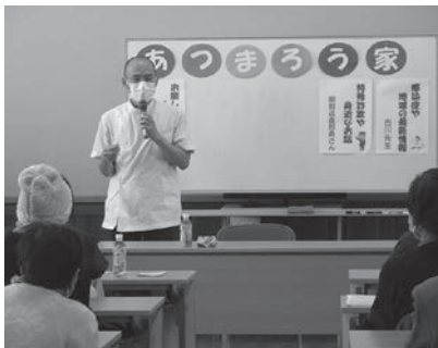
吉川先生から感染症のおはなし

今回は、コロナ禍のため、食事提供はしませんでした。「久しぶりじゃねー、元気にしとったん？」などお互いの体調を気遣っている様子を見て、吉和だからこそつながりを感じました。これからも、地域のつながりを大切にしながら、地域福祉を進めていきます。