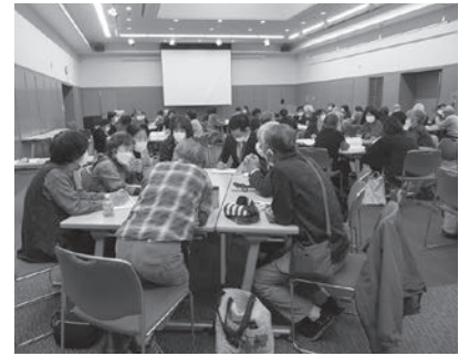
地域のこと、一緒に考えます！