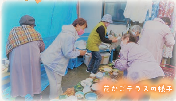
花かごテラスの様子