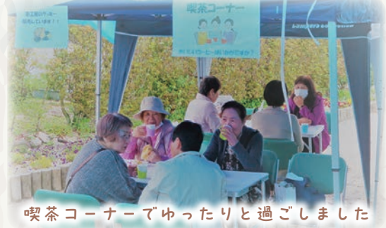
喫茶コーナーでゆったりと過ごしました