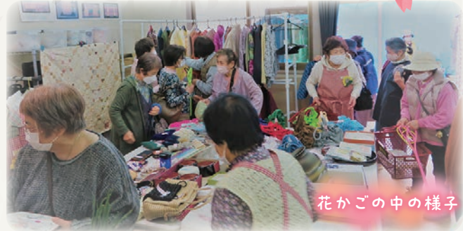
花かごの中の様子