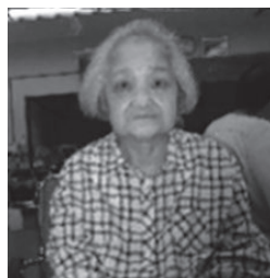
いつも電話ありがとう (あんしんほっとコール利用者より)

人を対象に、希望の曜日、時間帯に、安否確認や体調確認の電話をかける「あんしんほっとコール」という事業を行なっています。ひとり暮らしに不安がある人、お気軽にご連絡ください。