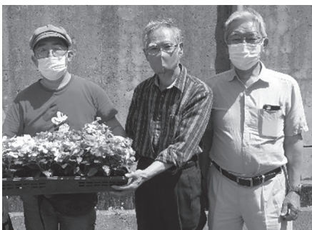
大切に育てた花を地域の人たちへ!!

地域の花壇に咲いているお花。就労継続支援B型事業所「Hanaと花舎」と協力して、地域にお花と笑顔を咲かせています。