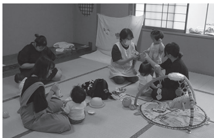
育児のあれこれ・・・ ママたちの話にも花が咲きます

参加者からは「子どもが0歳だと出かける機会が少ないので、月に一回のこの会がありがたい」「ここでは子育ての悩みを話せて親の息抜きや、情報交換の場