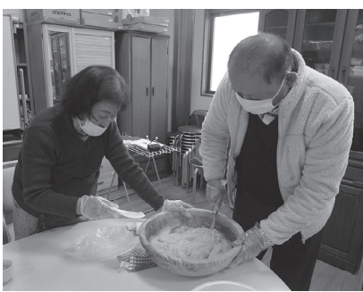
しっかり混ぜて、おいしくなあれ

参加者は「コンニャクを作るなんて初めてよ」「今回で3回目じゃけど、形がうまくできんね」とおしゃべりも弾みます。お昼にできたてを調理してみんなでおいしくいただきました。市社協はこのような取組を継続し、地域の誰もが活躍し主役になれる吉和地域を目指します。