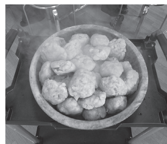
不揃いですがアツアツで立派なコンニャクができました