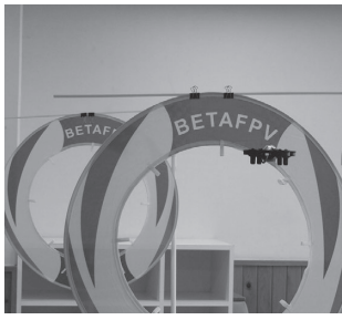
参加者が操作したドローン可愛らしい手のひらサイズ

今回は山崎本社みんなのあいプラザで、日本ドローン機構株式会社のインストラクターを招き「ドローン操作体験会」を開催しました。