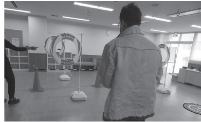
「上手！上手！」とみんなからの声援。2チームにわかれて対戦！大接戦に！！

インストラクターによると「テレビゲームが上手な人はドローン操作が上手」とのこと。参加者はインストラクターの説明を真剣に聞き、すぐに操作のコツをつかんでいました。