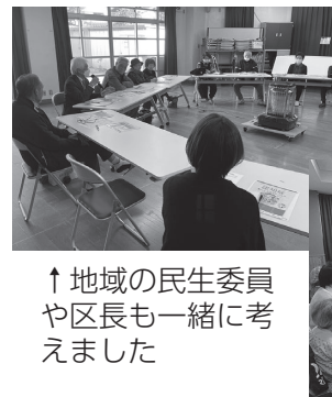
地域包括支援センターについて詳しく知ることができました↓