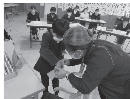
おばあちゃんと一緒にモノを探します

11月24日、津田小学校5年生を対象に認知症サポーター養成講座を行いました。講座は、教材の動画を視聴した後、より理解を深めるために認知症という病気の原因や症状、どういう対応をしたら良いかについてキャラバン・メイトが児童と対話をしながら進めました。後半は、キャラバン・メイトによる孫とおばあちゃんが買物に行く悪い例の寸劇を見て、登場する人の気持ちや自分ならどうする