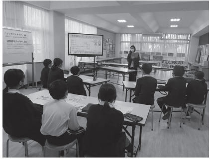
「認知症」という言葉はみんな知っています

かなどを考えました。最後に児童の代表は、どんな対応をしたらおばあちゃんが悲しい思いをしないかを考え、安心して買物ができるとても優しい対応を実演することができました。