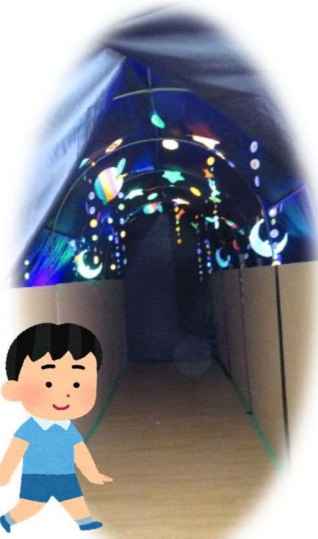
光るトンネル体験のブースのボランティアから「久しぶりに子どもたちの喜ぶ顔が見られてうれしかった」