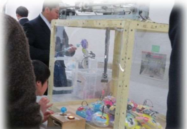
宮島工業高校生徒作製のクレーンゲームは大人気!