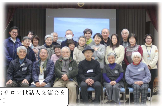
これからも阿品台サロン世話人交流会を開催していきます!

「サロンの世話人」も「サロンの参加者」も楽しくサロンが続けられるように、これからも市社協はサロン活動を応援してまいります!!