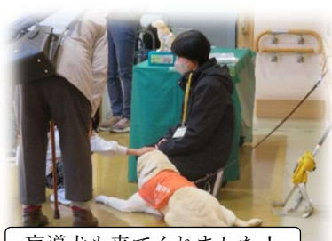
盲導犬も来てくれました!