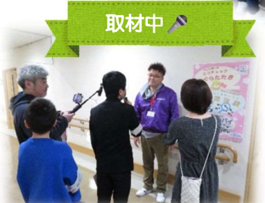
取材中 FMはつかいちによる、キッズリポーターの取材もありました