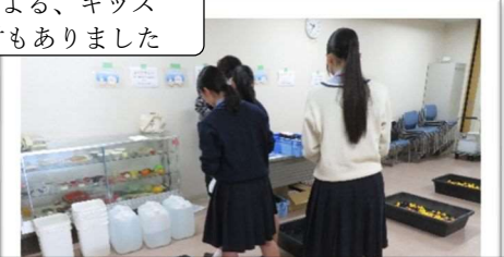
学生ボランティアも大活躍! お助け屋敷やめだかすくいのブースなどで、イベントを盛り上げてくれました