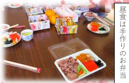
昼食は手作りのお弁当

この日は5人の参加者で、お花見会を兼ねた昼食会!!「すっかり葉桜になっちゃったね~」「最近野菜が高いね~」など話は尽きません。桜はありませんが、楽しい会話に花が咲きました。