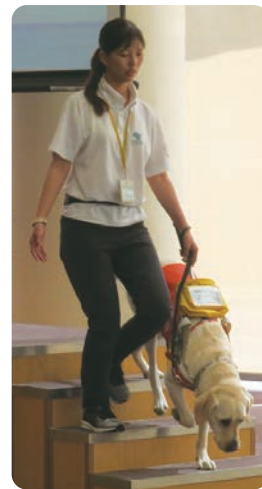
←盲導犬が動きで曲がり角や階段を知らせることで、盲導犬ユーザーは、周囲の状況を理解することができると思いました

「盲導犬がわかるの?」や「盲導犬がわかる言葉は、何種類ありますか?」など、次々と質問が挙がっていました。廿日市市にも盲導犬ユーザーがいらっしやいます。視覚障がいのある人がもし困っていただいきなり腕や肩にさわられるのではなく「何かお手伝いしましょうか」とひと声をかけて、お手伝いをお願いします。