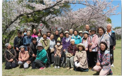
高齢者や障がい児、子育ての地域のつどい・サロンへの助成