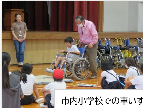
市内小学校での車いす体験等、福祉教育の推進

皆様からいただいたご寄附は、当会が実施するさまざまな事業を通じて、地域福祉の推進に活用させていただきます。