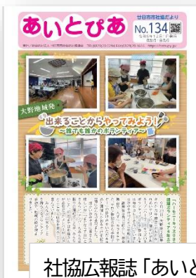
社協広報誌「あいとぴあ」の発行等、福祉に関する情報の発信