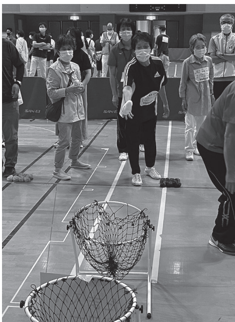
障がい者ふれあいスポーツ大会では、 おそろいのベストを着てお手伝いと応援 をしました