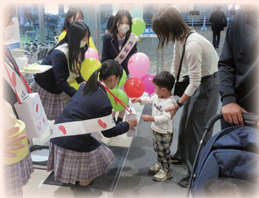
街頭募金では、山陽女学園の生徒の皆さんにご協力いただき、たくさんのお気持ちを預かりました