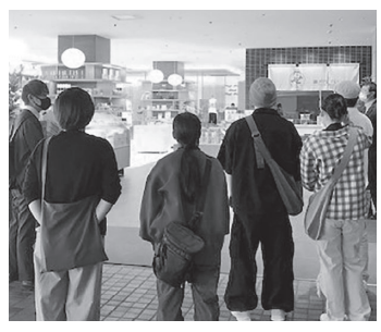
昨年度、初実施した職場見学は好評でした

皆さんから仕事に関するこのような相談を受け、その人に合った仕事の紹介、履歴書の書き方や面接の練習、どんな仕事が自分に合うかを確認する職業適性検査などを実施しています。 また、仕事をする自信がない人には職場見学や就労体験を実施し、仕事に対する理解を深める支援もしています。