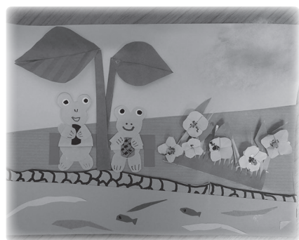
5月・6月のデザイン 野に咲く花とカエルがかわいい!