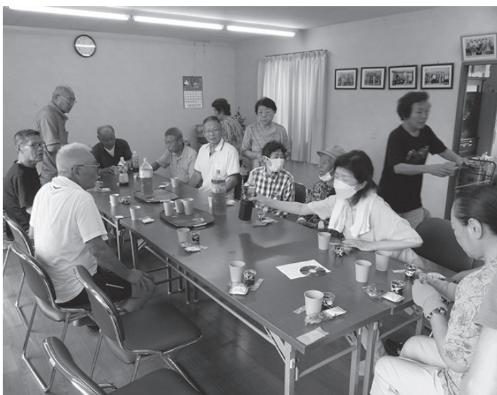
サロン訪問時に皆さんと雑談を交えながら、情報共有

誰もが安心して地域で暮らし続けられる地域づくりを、住民と一緒に進める役、SCと略してということもあります。