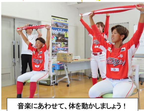
音楽にあわせて、体を動かしましょう!