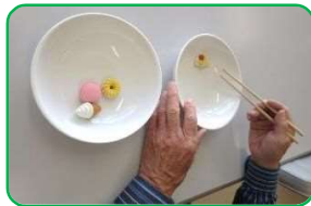
アイマスクをして、箸を使っ てお皿へ食べものを移す ランチゲーム