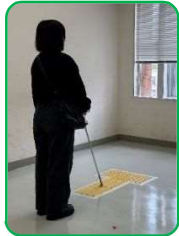
アイマスクをして、 白杖での歩行体験