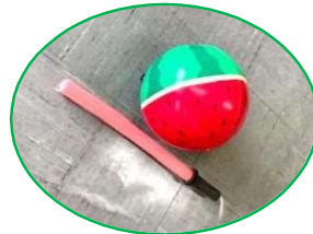
アイマスクをして、 スイカ割りや輪投げ など