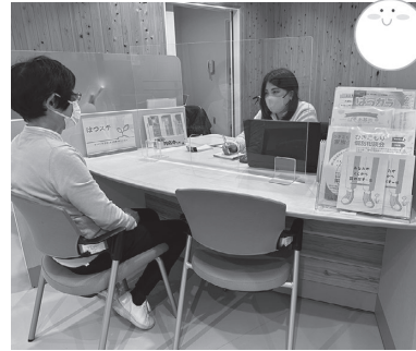
相談を丁寧に行っています

ひきこもりがちな人への支援は、すぐに結果が表れません。家族とは良好な関係を築けたものの、本人とは顔を合わせることもできないまま月日が過ぎることもあります。「はつステ」では、それぞれのペースを尊重し、粘り強く支援を行なっていきます。