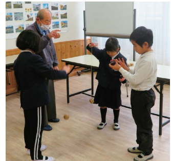
ヨーヨーできるかな

参加した児童からは「コマが回せた」「だるま落としが楽しかった」といった声が聞かれ、昔遊びの魅力を存分に味わった様子でした。