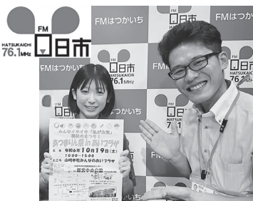
市社協実施のイベントの情報などもお伝えしています

内容は、仕事を選んだきっかけや、利用者とのエピソード、先輩からの忘れられない一言など会話しながら、仕事のやりがいや楽しさを伝えていきます。ぜひ聞いてください!