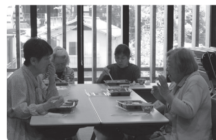
カキフライおいしいわね

宮島地域独自事業として、70歳以上のひとり暮らし高齢者を対象に「高齢者給食サービス」と「高齢者懇談会」を実施しています。民生委員が気になる人に呼びかけたり、住民同士も誘い合い、宮島支所職員、保健師、ケアマネジャー、社協職員も一緒に「宮島の食を推進する会」の手作りのふれあい弁当で会食します。また、振り込め詐欺や宮島訪問税など、その時々で住民の関心があるテーマの懇談会を行なっています。