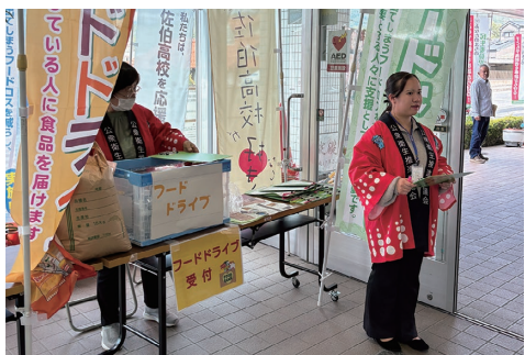
フードドライブコーナー

市社協では、看護師の資格を活かして地域の健康維持活動をしている人に、市民センター、地域包括支援センターなどの多機関と一緒に後方支援をしています。このような制度やサービスにはない「住民ならでは」の福祉活動に関わり、「おもいやりのあるまちづくり」を推進しています。今年度はこの事業を通じてつながった新しい社会資源を、地域の「困りごと」を抱えている人への支援につなげていきます。