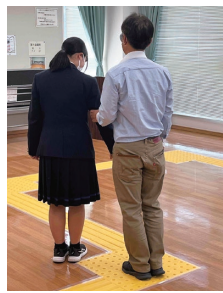
アイマスクの体験コーナー

令和6年度は10月26日に「心と心のハーモニーフエスタ」で、佐伯高等学校の「探求」授業で福祉に興味をもった学生に発表の場を提供し、佐伯地域の担い手の創出につなげました。