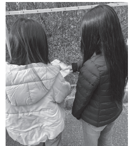
ポスティング先を地図で確認します

さらに、本紙「あいとぴあ」の配布にも7人が携わりました。地図を確認しながら担当エリアを歩き、一軒ずつ丁寧にポスティングを行う作業は、責任感や持続力を養う貴重な機会となりました。「最後までやり遂げられた」という実感は、就労への意欲を高める重要な経験となったようです。