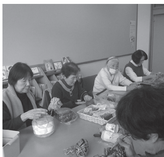
おしゃべりしながら編み物を楽しむ参加者

これからも、地域の人々が集い、交流できる場として「あみあみサロン」を支援していきます。