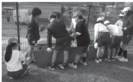
最後のプランターは児童全員で植えました

落ち葉清掃では、「たくさん集まったよ」「こっちは落ち葉がたくさんあるから、きれいにしよう」と声をかけ合いながら、楽しそうに取り組む姿が見られました。袋いっぱい集めた落ち葉を見て、達成感のある表情を浮かべる子どもたちの姿