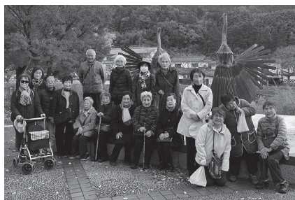
歩いて心がつながる温かなひととき

今回の歩行訓練では、けがなく無事に全行程を終えることができただけでなく、会員同士の深いつながりや助け合いの力を感じる貴重な機会となりました。 地域の中で、こうしたささえあいの輪が広がっていくことは、安心して暮らせるまちづくりにつながります。市社協は、皆さんの活動を大切にしながら、今後も寄り添い、ささえ合える地域づくりに取り組んでまいります。