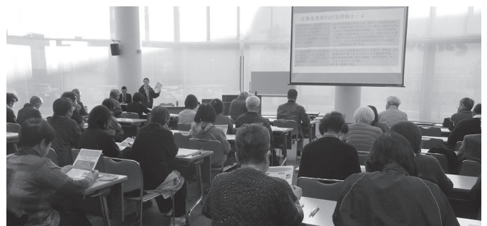
市民・福祉関係者など31人が参加しました

ディングノート「わたしの人生ノート」が紹介され、参加者が日常生活でできる準備の参考になりました。 セミナー終了後には個別相談会も実施し、「もう少し年をとってから考えれば良いと思っていたが、事前に準備することの大切さが分かった」といった感想が寄せられました。 今後、成年後見制度をはじめとした権利擁護支援の周知に努め、誰もが安心して暮らせる地域を目指します。