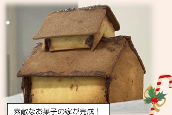
素敵なお菓子の家が完成！