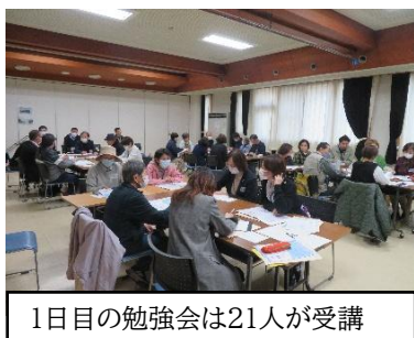
1日目の勉強会は21人が受講

2回の勉強会を経て、2人の受講者が運転ボランティアとして登録されました。今後も事業所、サロン世話人などと協力して、移動支援の実現に向けて取り組みます。