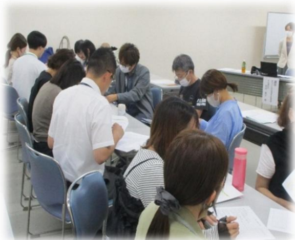
↑ロールプレイの様子